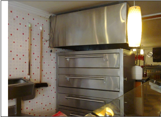
Fotografía 5. Horno para pizza