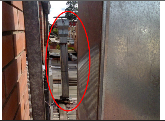
Fotografía 6. Ducto del horno para pizza

De esta manera, las acciones desplegadas en el establecimiento de comercio son contrarias a las normas ambientales en materia de emisiones atmosféricas, específicamente a las siguientes: