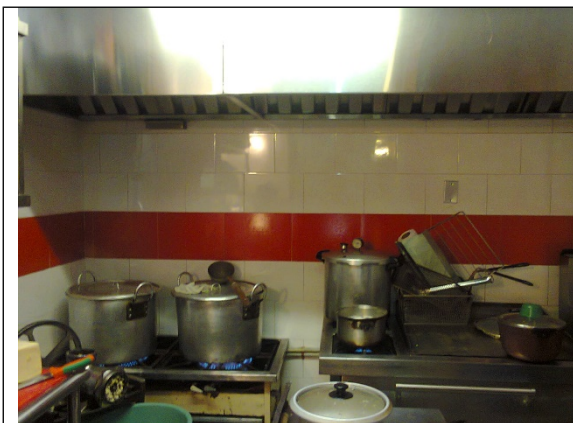
Fotografía 3. Estufa de tres (3) puestos y plancha

Lo anteriormente expuesto, se puede apreciar en el registro fotográfico contenido en el insumo técnico No. 09487 de 28 de octubre de 2014 y que data del 4 de agosto de 2014: